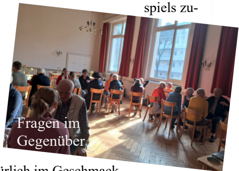
Fragen im Gegenüber

eine extreme Komplexität eigen. Insofern war es die perfekte Produktwahl, um mit den Details dieses Beispiels zugleich über uns ins Gespräch zu kommen. Eine Überraschung hatte Liv, mit ihren