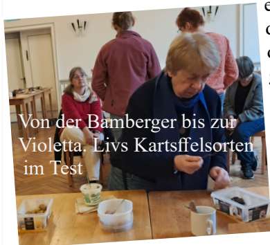
Von der Bamberger bis zur Violetta. Livs Kartoffelsorten im Test

und im Blick auf Anbau, Ernte, Verarbeitung und Vielfalt